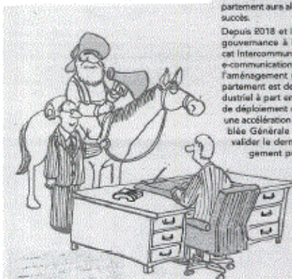
« La fibre n'est pas encore installée. C'est une bonne chose que nous ayons gardé le gars du pony express »

Orange a en charge le déploiement de la fibre dans 14 communes du département. Oyonnax, qui possède 45 % de prises éligibles, vient d'être