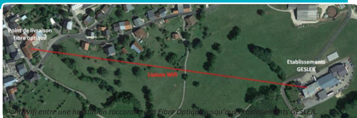
Pont Wifi entre une habitation raccordée à la Fibre Optique jusqu'aux établissements GESLER.

Cette installation permet désormais aux établissements GESLER d'accéder à un débit de 95 MEGA bit/s. L'entreprise peut donc désormais continuer son activité en toute sérénité !