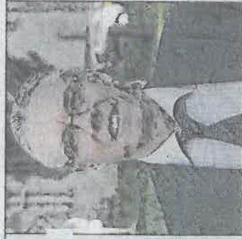
Jean-Luc Guyader, président de la communauté de communes de la Plaine de l'Ain